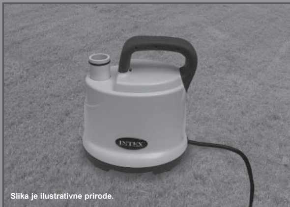
Slika je ilustrativne prirode.

Ne zaboravite da isprobate druge izuzetne proizvode Intexa: bazene, dodatke za bazene, bazene i kućne igračke na naduvavanje, krevete na naduvavanje i čamce. Potražite ih u dobro opremljenim prodavnicama ili posetite našu dole navedenu internet stranicu. Zbog politike stalnog poboljšanja proizvoda, Intex zadržava pravo izmene specifikacija i izgleda usled čega priručnik s uputstvima može biti ažuriran bez obaveštenja.